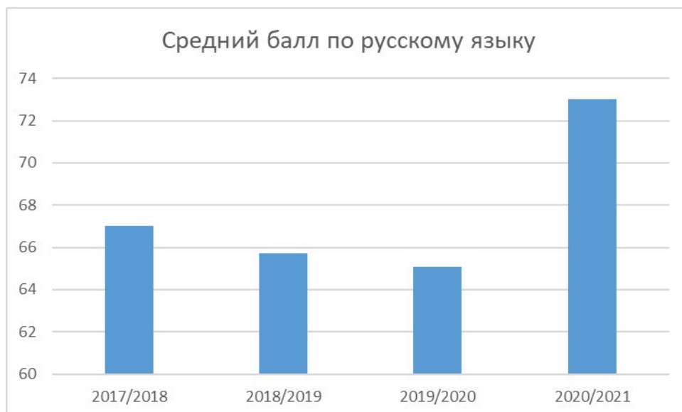
Диаграмма 1. Результаты ГИА по русскому языку в форме ЕГЭ в сравнении за последние три учебных года